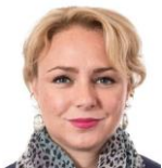
Ledare, Göteborgs Posten 2:a februari 2018

”Priset för billiga läkemedel är livsfarliga utsläpp”